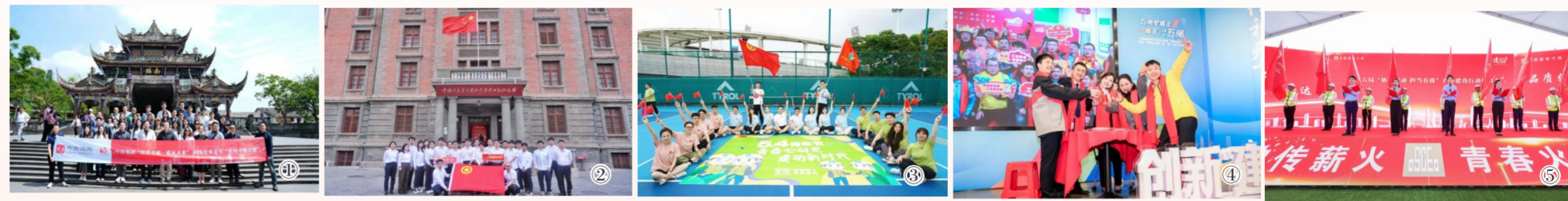
图①中海集团举办“经营幸福,建证未来”两地优秀青年“双向寻根之旅”暨“浪潮文化交流论坛”活动。图②中建国际所属中建-大成公司团委组织团员青年赴北大红楼开展“挺膺担当 团结奋斗”主题团日活动。图③中建二局海南公司珠海分公司团支部开展“团结奋进新时代 青春挺膺向未来”庆“五一”“五四”主题活动。图④中建五局团委开展企业文化品牌故事展演、特群员工宣讲和青年员工演讲比赛等丰富活动。图⑤中建六局工会与天津大学马克思主义学院联合举办青春分享会。

劳动创造幸福,青春创享未来。在“五一”国际劳动节、“五四”青年节来临之际,中建集团各级工会、共青团组织开展丰富多样的主题活动,弘扬劳动美,礼赞奋斗者;激扬青春风采,建证美好未来。