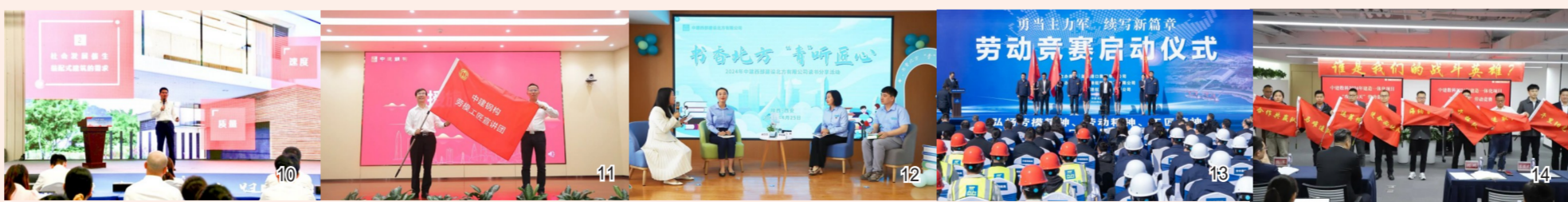
图10中建装饰工会邀请四位劳模工匠结合自身学习体会与成长经历讲述新时代的劳模故事,分享经验,传授心得。图11中建科工旗下中建钢结构工会举办劳模工匠宣讲团成立仪式暨总部劳模工匠宣讲活动。图12中建西部建设北方分公司工会举办“书香北方,青”听匠心”读书分享会。图13中建港航局工会以“勇当主力军 续写新篇章”为主题,携手湖北港口集团举办重点工程劳动竞赛。图14中建教科举行“五一”“五四”主题活动,激励全体职工弘扬劳模精神、劳动精神、工匠精神。

劳动创造幸福,青春创享未来。在“五一”国际劳动节、“五四”青年节来临之际,中建集团各级工会、共青团组织开展丰富多样的主题活动,弘扬劳动美,礼赞奋斗者;激扬青春风采,建证美好未来。