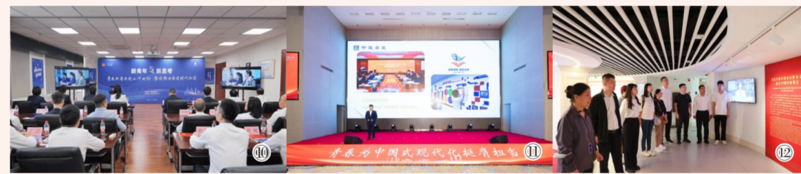
图⑩中建方园团委举办“新青年 新思考”主题活动。图⑪中建安徽团委开展“青春为中国式现代化挺膺担当”五四主题团日活动。图⑫中建科技华北分公司团支部前往宋庆龄故居开展党风廉政建设主题活动。