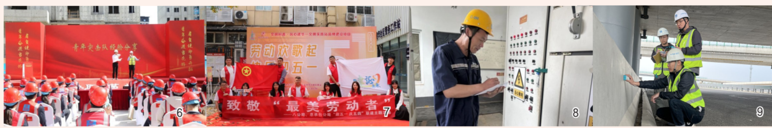
图6中建新疆建工工会举行2024年底“五一”“五四”表彰大会。图7中建西院各级工会组织开展“致敬最美劳动者”主题实践活动。图8中建发展旗下中建生态环境集团工会组织密云农污项目职工开展运营技能比拼。图9中建交通各级工会组织开展劳模宣讲、拜访时代楷模、导师带徒、技能大赛等主题活动。