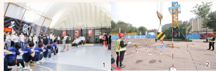
图1基础部(中建基础)各级工会组织开展“幸福基业”系列主题活动。图2中建一局工会举办2024年劳动和技能竞赛/劳模(工匠)宣讲进工地活动启动仪式暨工匠学院/机械设备培训基地成立仪式。