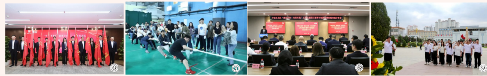
图⑥中建八局团委在沪举办“永不褪色的青年突击队”暨暨纪念五四运动105周年主题活动。图⑦中建设计研究院团委举办“建证未来·名院正青春”迎“五四”主题拔河比赛。图⑧中建东北院举办“建证未来·攻坚有我”五四主题团日暨青年创新创效经验交流分享会。图⑨中建市政西北院团委开展“传承五四精神 青春筑梦未来”主题团日活动。