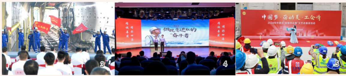
图3中建三局各级工会开展多种形式的“五一”表彰活动。图4中建四局土木公司工会组织开展2024年企业文化宣讲会。图5中建七局各级工会相继开展庆祝“五一”国际劳动节系列活动。