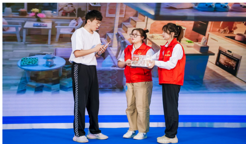
近日,广州市黄埔区举办第三届新时代文明实践志愿服务项目大赛,中建四局华南建设公司靠埔“小鲁班”青少年建筑启蒙项目从60支队伍中脱颖而出,斩获大赛金奖。大赛还成立了由中建四局等爱心企业组成的“靠埔公益联盟”,广泛激活社会力量,推动志愿服务事业高质量发展。(何佳缘)