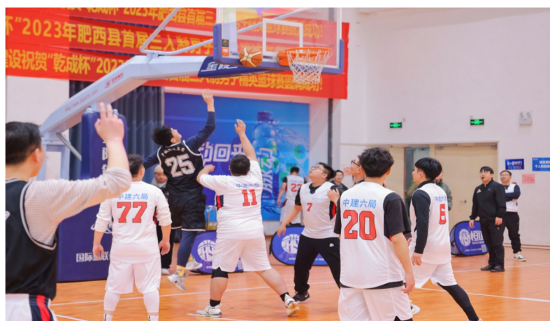
近日,中建六局第八建设公司携手合肥属地企业开展“共生杯”球类友谊赛,强化企业间的互动交流,丰富职工文化生活。(杨硕)