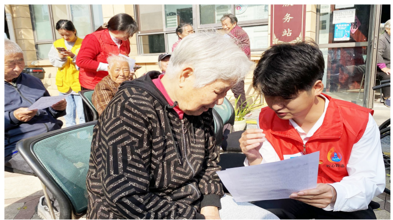
近日,中建安装南京公司安装分公司党支部、团支部联合南京市青田雅居社区开展“暖冬关爱”志愿服务活动。志愿者通过发放宣传单、开展主题宣讲等方式积极做好消防安全知识普及工作,助力打造“平安社区”。(沙婷婷)