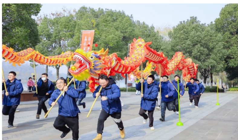
近日,中建三局基建投公司武汉分公司在武汉后官湖国家湿地公园白莲湖广场举办第二届职工趣味运动会,激励员工以积极饱满的精神状态向着新年新目标阔步迈进。(李彬)