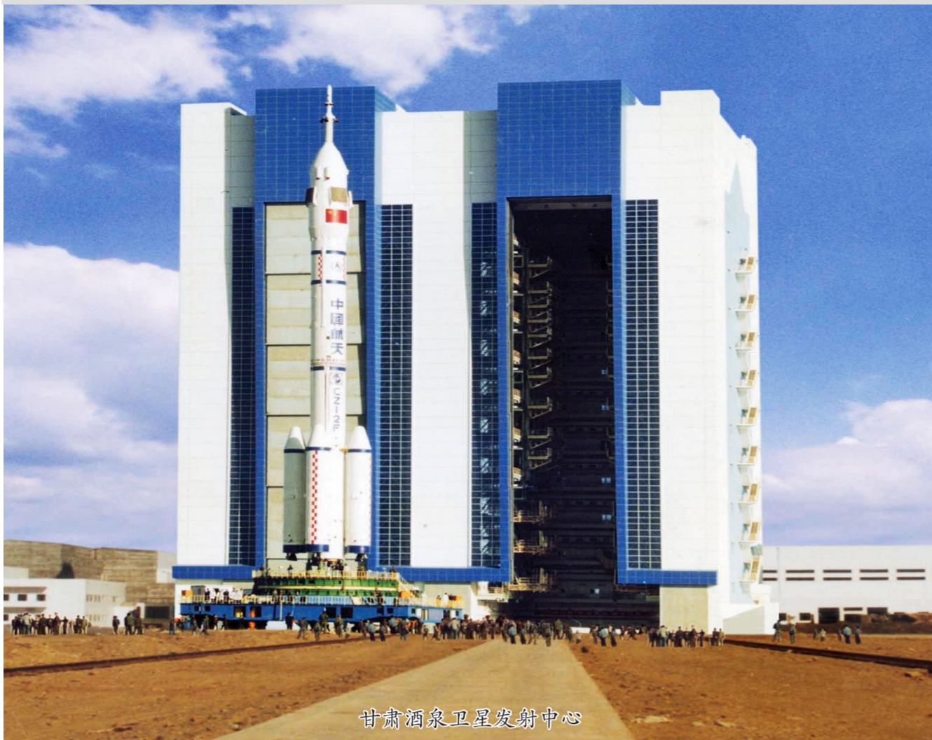
甘肃酒泉卫星发射中心