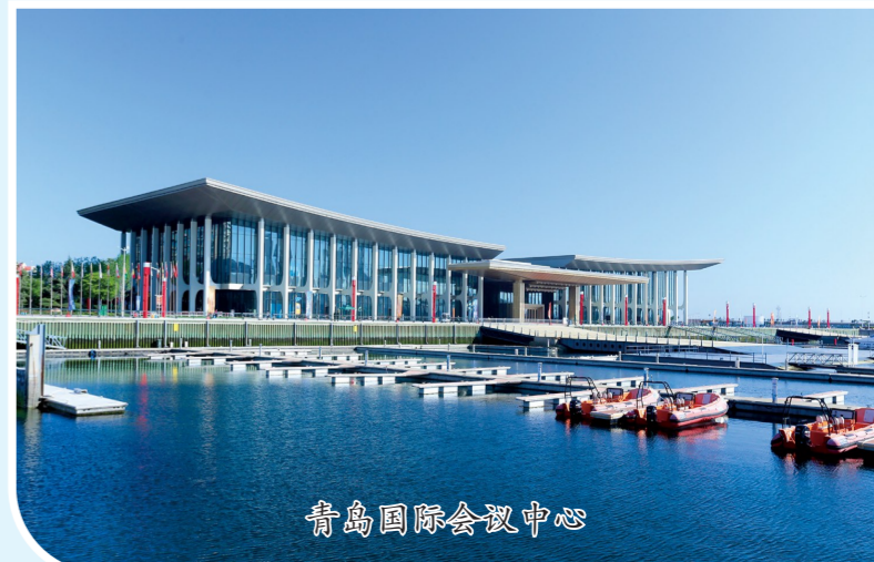
青岛国际会议中心