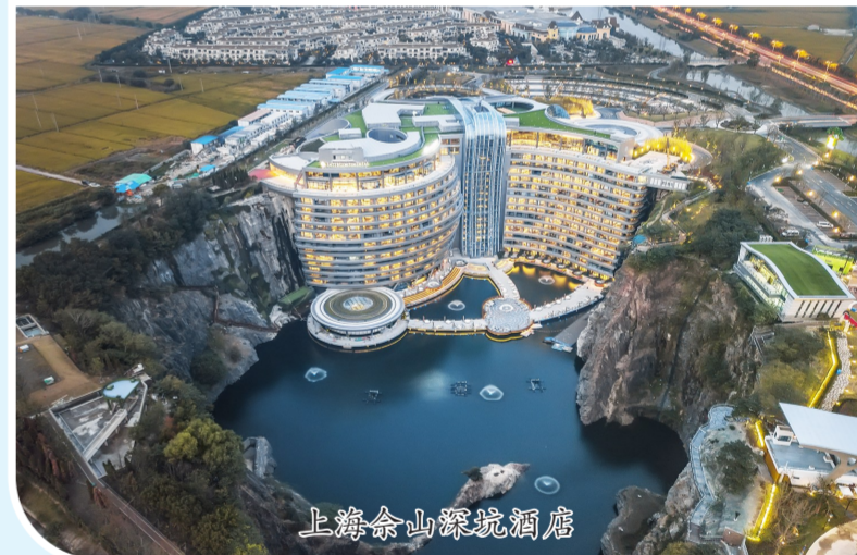
上海佘山深坑酒店