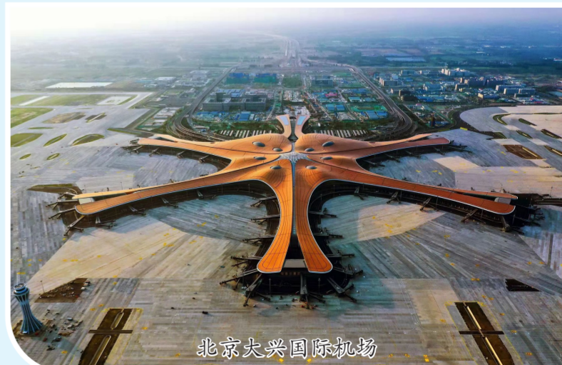
北京大兴国际机场