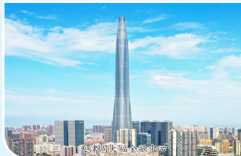
天津周大福金融中心

莫道万里征途远，厉兵秣马再启程，40年砥砺奋斗绘就壮美画卷。未来，秉承“军魂匠心 家国情怀 令行禁止 使命必达”铁军文化的中建八局，在实现“三标杆 两示范”世界一流投资建设集团的新征程上阔步前行，勇当中国建筑创建世界一流示范企业的标杆。