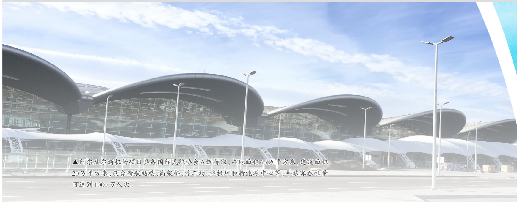
▲阿尔及尔新机场项目具备国际民航协会A级标准,占地面积65万平方米,建筑面积20万平方米,包含新航站楼、高架桥、停车场、停机坪和新能源中心等,年旅客吞吐量可达1000万人次。