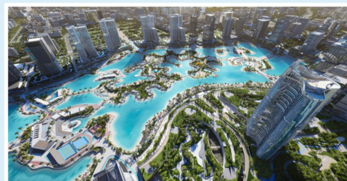
▲阿拉曼新城超高层综合体项目总建筑面积约为109万平方米,工程内容包括设计、建造1座超高层精装修标志塔、4栋超高层精装修住宅及商业配套和市政景观工程。