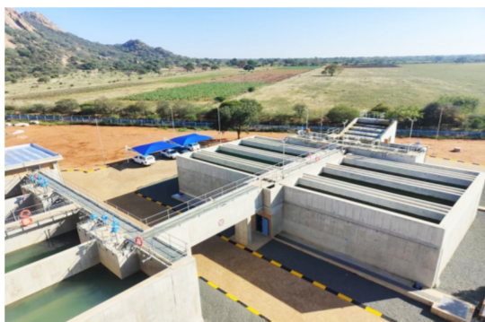
▲博茨瓦纳马哈拉佩水厂项目位于博茨瓦纳首都哈博罗内以北200公里的马哈拉佩镇,建成后,水厂供水能力从原先的每天16兆升提高至34兆升,有效提高了水厂供水能力,缓解了当地居民用水难的问题,并改善当地居民的用水质量。