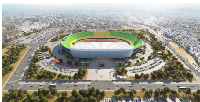
▲援塞内加尔4座体育场维修项目是进入新世纪以来中国在塞实施的规模最大的援助项目,也是中非合作论坛相关举措的后续具体落实。建设内容包括对桑戈尔、久尔贝勒、考拉克及济金绍尔4座体育场进行维修、升级改造。其中,桑戈尔体育场维修、改造后将成一座功能完善、具备专业赛事条件的大型体育场,将作为塞内加尔承办2026年世界青奥会的主场馆。