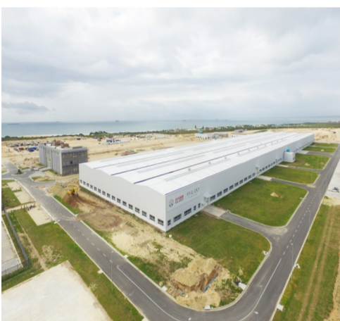
▲北汽南非汽车厂项目总面积超54万平方米,是南非40年来最大的绿地投资项目,也是南非及非洲一次性投资规模最大的汽车制造厂。2018年,中国国家主席习近平和南非总统拉马福萨共同见证了第一辆在南非本地组装生产的北汽汽车成功下线。