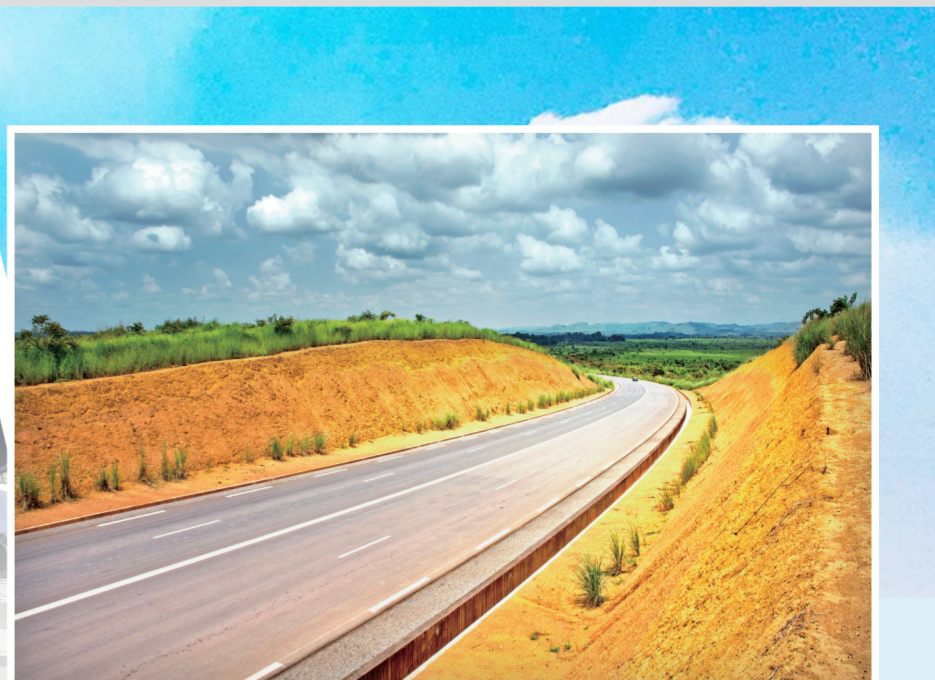
▲刚果(布)国家1号公路项目全长约535公里,是目前刚果(布)等级最高、通行体验最好的公路,还是中刚建交50年来,中刚两国之间最大合作项目,被誉为刚果(布)的“梦想之路”。