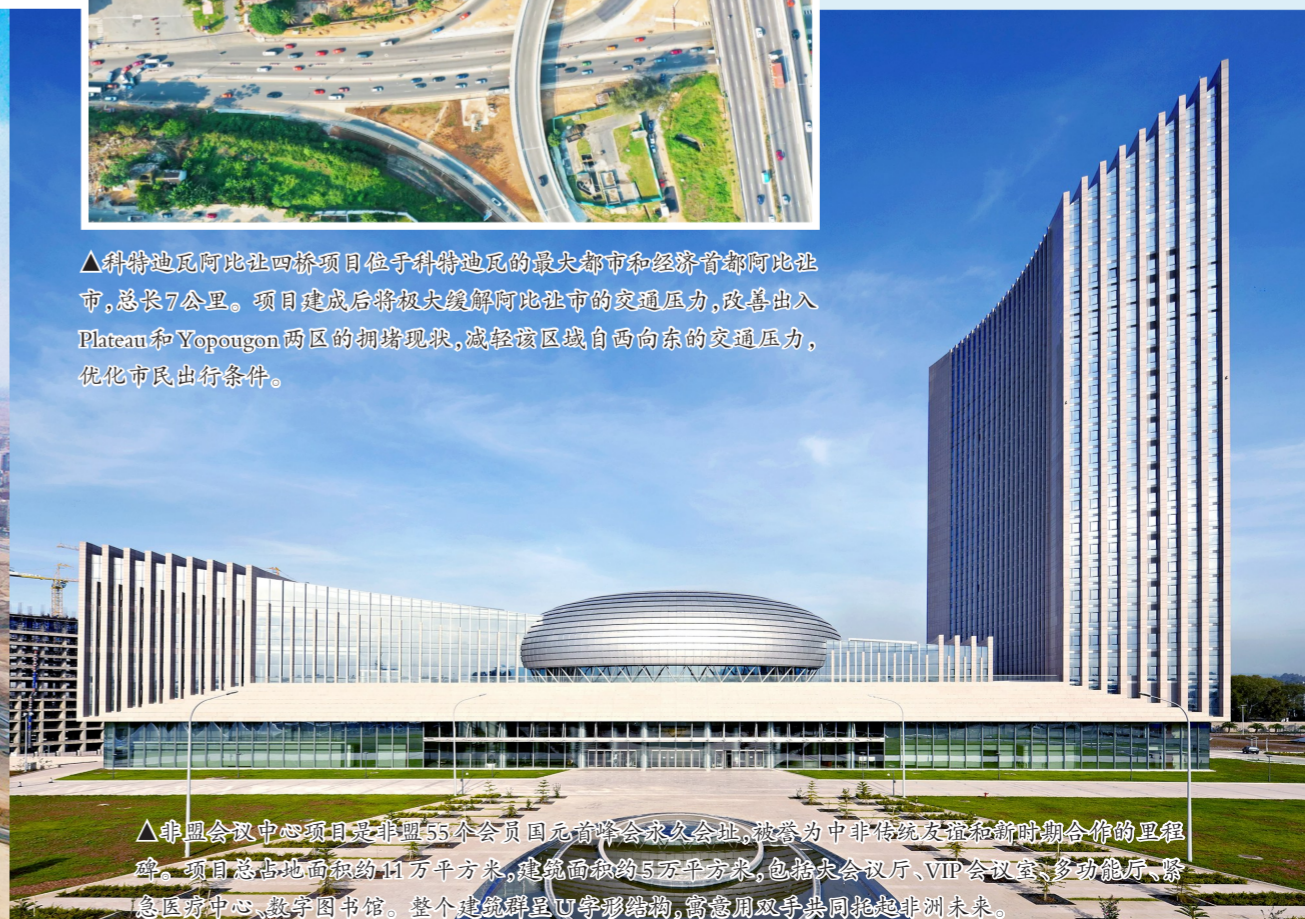
▲非盟会议中心项目是非盟55个成员国元首峰会永久会址,被誉为中非传统友好和新时代合作的里程碑。项目总占地面积约11万平方米,建筑面积约5万平方米,包括中央会议厅、VIP会议室、多功能厅、紧急医疗中心、数字图书馆。整个建筑群呈U形结构,寓意用双手共同托起非洲未来。