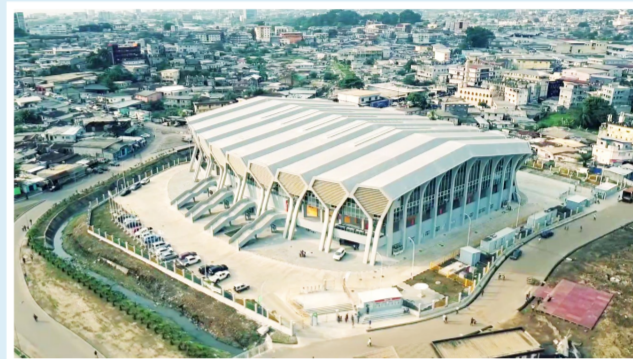
▲加蓬利伯维尔体育场项目位于加蓬共和国首都利伯维尔,总建筑面积1.2万平方米,是2018年非洲洲际足球赛主场馆,满足举办国际赛事条件,兼具举办篮球、拳击、会议、展览、音乐会等多种功能,荣获境外国家优质工程奖。

从阿尔及利亚南北高速公路、刚果(布)国家1号公路等大型基础设施项目,到博茨瓦纳马哈拉佩水厂等“小而美”惠民工程……中国建筑坚定不移践行“一带一路”倡议,全面实施“一六六”战略路径,深入落实海外高质量发展战略,与非洲国家不断深化合作,共同拓展幸福空间。