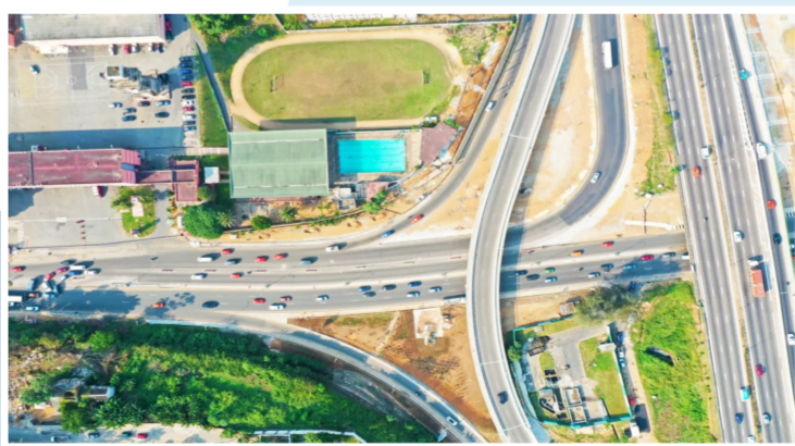
▲科特迪瓦阿比让四桥项目位于科特迪瓦的最大都市和经济首都阿比让市,总长7公里。项目建成后将极大缓解阿比让市的交通压力,改善出入Plateau和Yopougon两区的拥堵现状,减轻该区域自西向东的交通压力,优化市民出行条件。