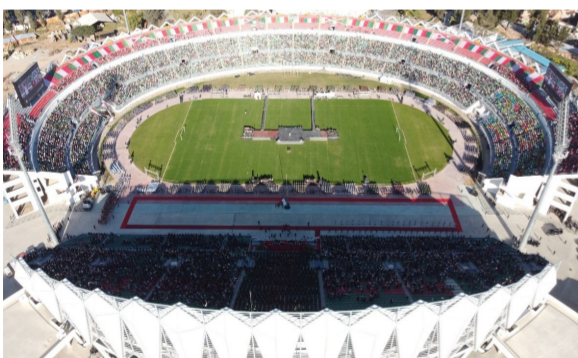
▲马达加斯加国家体育场改扩建工程被马达加斯加总统称为“国家的骄傲,后代的遗产”。项目占地面积约13万平方米,改造后体育场座位数将达到4万座,并包含足球训练场、篮球场、商业等一系列配套设施,达到FIFA标准,成为马达加斯加国内最高标准的体育场。