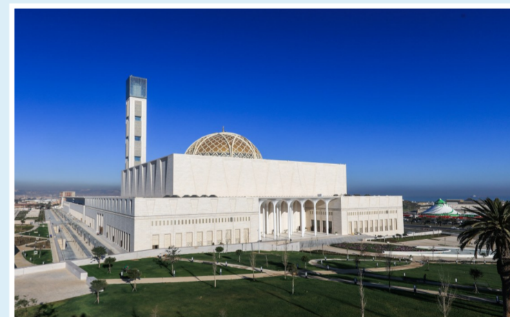
▲阿尔及利亚嘉玛清真寺项目位于阿尔及利亚首都阿尔及尔港湾的中轴线位置,总建筑面积约40万平方米,共由12座单体构成。项目集多项世界之最于一身,是非洲第一、世界第三大清真寺,被称为阿尔及利亚“千年工程”,拥有世界上最大面积的室内祈祷大厅和世界最高的宣礼塔(265米),是目前世界最高的宗教建筑。