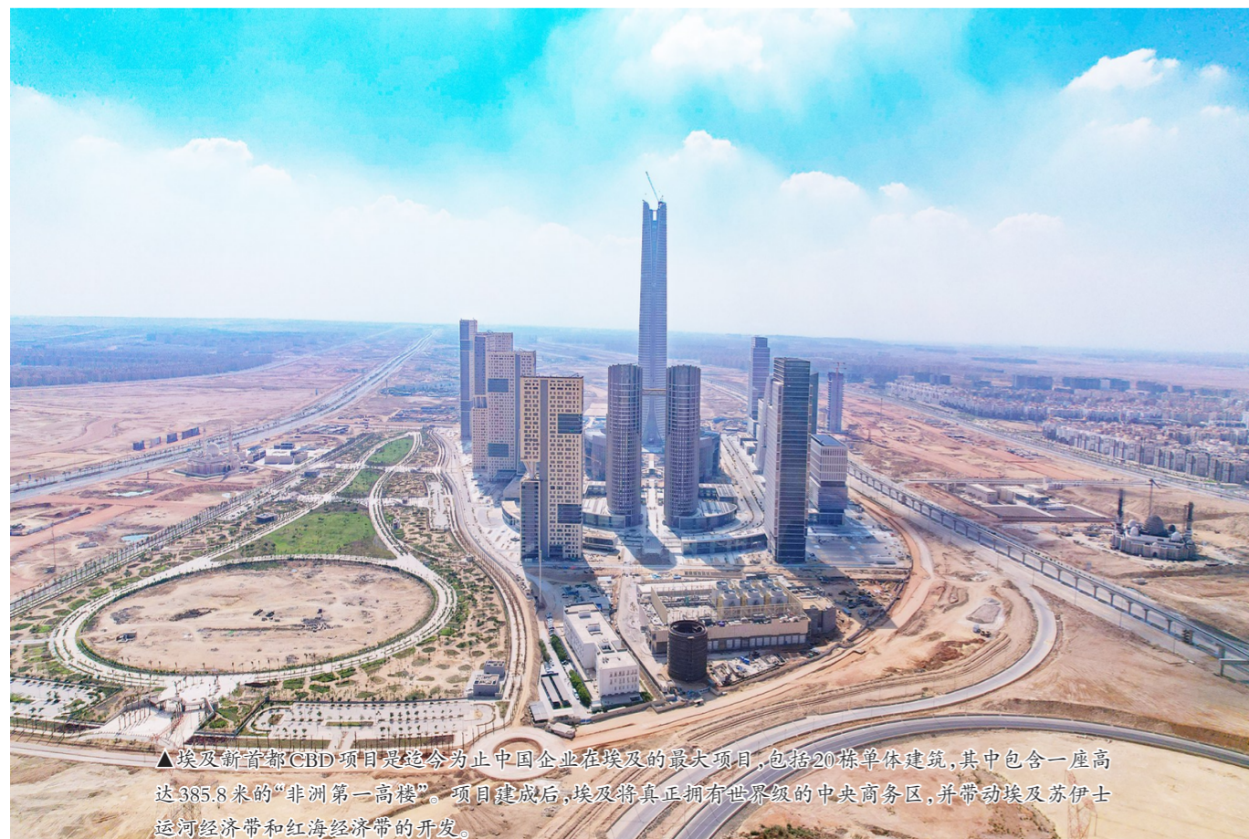
▲埃及新首都(CBD)项目是迄今为止中国企业在埃及的最大项目,包括20栋单体建筑,其中包含一座高达385.8米的“非洲第一高楼”。项目建成后,埃及将真正拥有世界级的中央商务区,并带动埃及苏伊士运河经济带和红海经济带的开发。