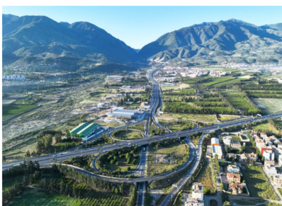
▲阿尔及利亚南北高速公路项目全长53公里,是从地中海直达非洲腹地、贯穿阿尔及利亚南北向的交通大动脉。项目的实施极大缩短了车辆穿越阿特拉斯山脉的时间,拉通了阿尔及利亚南北交通干道,打造了一条关系非洲南北发展的“阿尔及利亚南北经济走廊”。