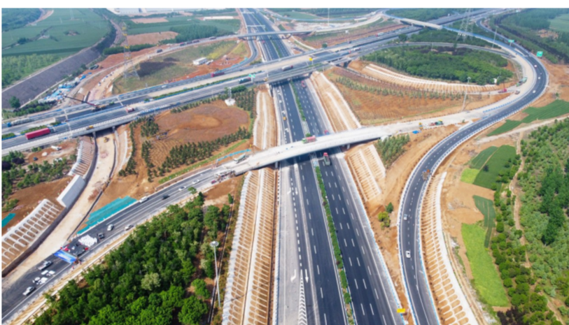
由中建五局河南公司承建的河南二广高速来家仓互通改扩建项目全线正式通车。