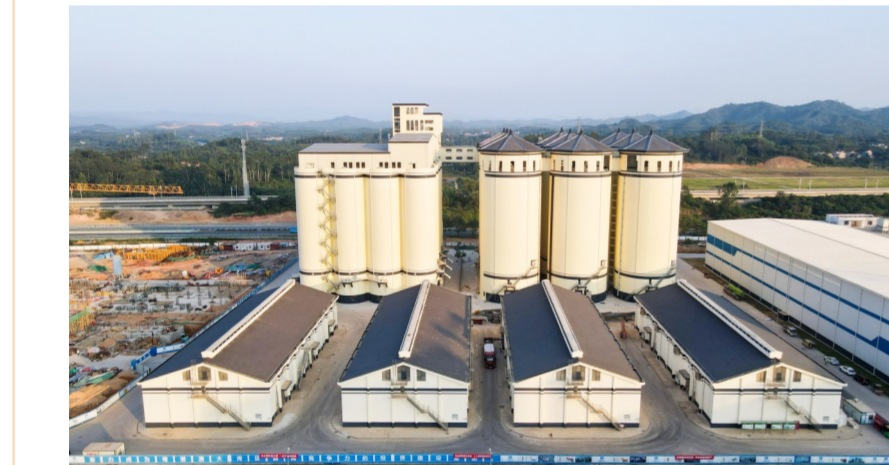
由中建四局承建的粤港澳大湾区(广东·惠州)绿色农产品生产供应基地项目一期冷链顺利通过竣工验收。

近年来,中国建筑坚持紧跟国家政策指引,完整把握、准确理解、全面落实新发展理念,“发展是第一要务,人才是第一资源、创新是第一动力”。