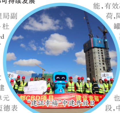
“建证幸福”中建开放日