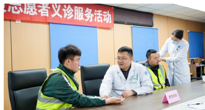
近日,中建二局华北公司烟台中医院改扩建项目联合烟台市中医院开展党员义诊服务活动,为200余名项目人员提供诊断治疗、心理健康咨询等服务。(封仁智)