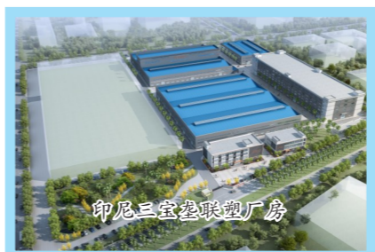
印尼三宝垄联盟厂房