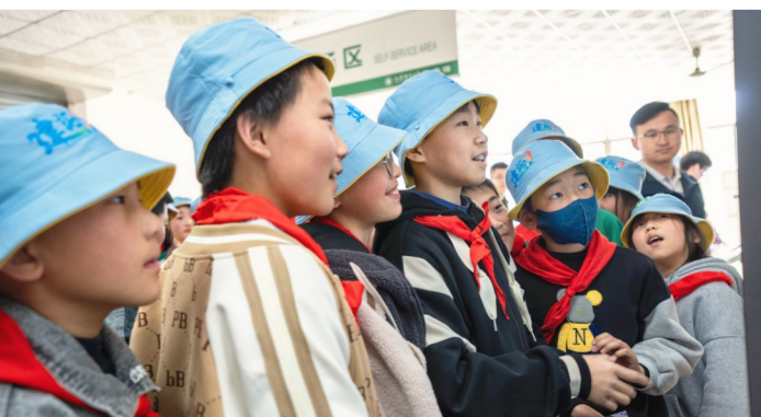
近日,中建科工江苏公司联合江苏师范大学文学院组织开展“春和景明 筑梦未来”主题活动,带领中建钢构三岔希望小学孩子们游览城市风貌、探访现代高校、拓宽知识视野。(邱实)