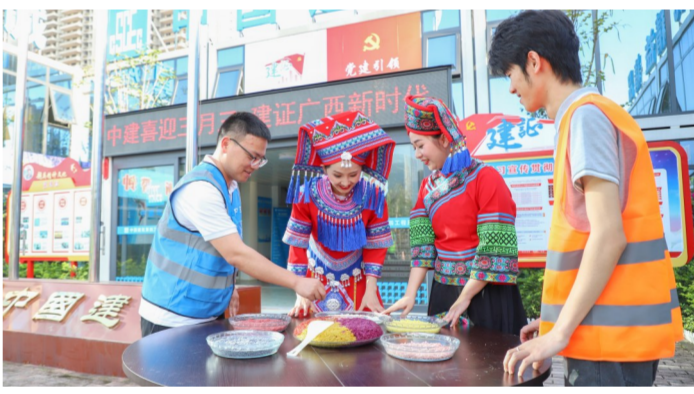
4月16日,中建四局良庆区妇幼保健院建设项目开展“喜迎三月三,建证新时代”民族文化活动,管理人员与工友体验对山歌、抛绣球、制作五色糯米饭等民俗活动。(李春振、杨俊麟)