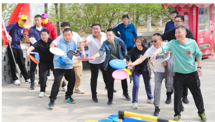
近日,中建三局总承包公司华北公司组织职工及家属开展春季徒步走活动,在春日里开展互动游戏,欣赏春日风景。(赵慕真)