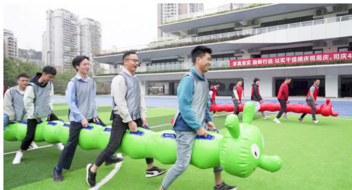
4月10日,中建八局四公司西南公司联合重庆市政协开展职工趣味运动会,参加员工赛场挥洒汗水、绽放青春,赛出了铁军的精气神和良好风貌。(牟俊辉)