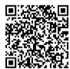
扫码阅读更多资讯

“授人以鱼不如授人以渔”。布图卡学园不仅是巴新现代化教育的缩影，它承载着为巴新培养人才的使命，也是中国与巴新友谊的新见证与象征。中国建筑将继续服务中国和巴新经济、人文、教育交往，为践行“一带一路”倡议作出新的更大贡献。