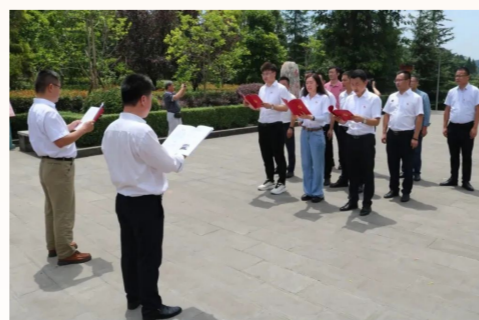
中建长江(西南区域总部)第二党支部全体党员以及入党积极分子以歌唱形式重温入党誓词，让入党誓词入脑入心，督促广大党员干部不忘初心继续前进。