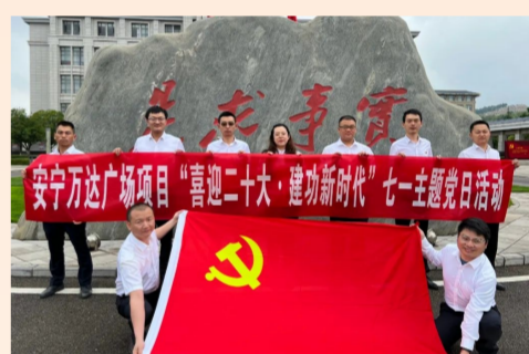
中建八局南方公司昆明安宁万达广场项目党支部组织全体党员到昆明市委党校纪律教育基地和党建主题馆参观学习，在党旗下重温入党誓词，接受深刻的爱国主义教育洗礼。