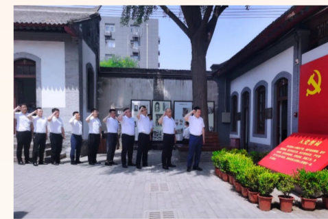
中建港航局西北事业部党支部全体党员、预备党员和入党积极分子前往八路军西安办事处缅怀先烈，重温入党誓词，引导广大党员牢记初心使命，奋力开创企业发展新局面。