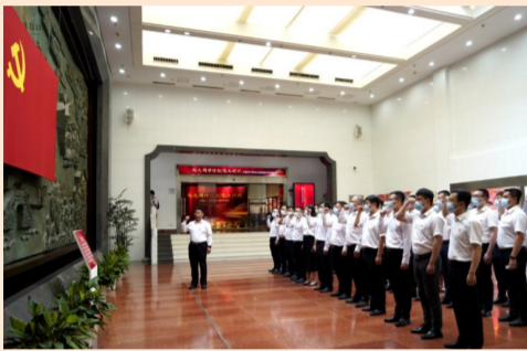
中建国际引导和帮助党员群众上好“大思政课”，国内事业部支部党员参观了苏州革命博物馆，重温入党誓词，接受红色历史的洗礼和熏陶。

在庆祝中国共产党成立101周年之际，中建集团各基层党支部组织开展“喜迎二十大 建功新时代”主题党日活动，将主题党日活动与深入学习贯彻习近平新时代中国特色社会主义思想充分结合，与贯彻落实党的二十大精神深度融合，通过主题党课、专题座谈会、实地研学、现场观摩、红色基石论坛、红色先锋事迹报告会等形式，庆祝中国共产党成立101周年，重温中国共产党百年奋斗的辉煌历程和伟大成就，深刻理解中国建筑发展历史。广大党员职工在学习中汲取力量、在感受光辉历程中坚定信仰，以红色精神激发干事创业热情、以实际行动传承红色基因，奋力推动企业高质量发展，以优异成绩迎接党的二十大胜利召开。