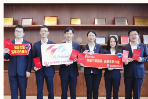
中建财务公司各党支部结合党风廉政教育季，积极开展“建证清风”观影及“清风建家”助廉绘画活动，引导广大党员持续发挥先锋模范作用。