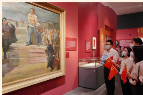
中建发展所属中建生态环境在京党支部组织党员赴国家博物馆参观“人格的力量——中国共产党人的家国情怀”主题展，深刻感悟共产党人的为民初心和家国情怀。