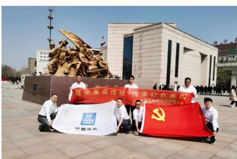
中建北方四平项目党支部组织一线党员职工参观四平战役纪念馆，开展体验式重温四平战役历史全过程，缅怀革命先烈，汲取英烈奋勇前行的精神力量。