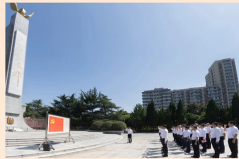
“我志愿加入中国共产党，拥护党的纲领，遵守党的章程……”中建三局总部党员代表赴武汉二七纪念馆参观研学，并在毛泽东亲笔题名的二七烈士纪念碑前重温入党誓词。