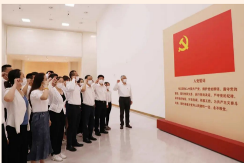
中建设计研究院总部一、二党支部及总部设计一院党支部参观了中国共产党历史展览馆，重温入党誓词，从党的奋斗历史中汲取前进力量。