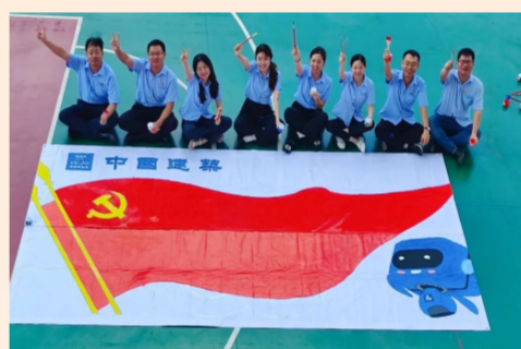
中建七局土木工程公司长沙绿地星城光塔项目党支部党员、入党积极分子及青年职工齐动手，共同绘制巨幅党旗，用行动表达中建员工的爱党之心。