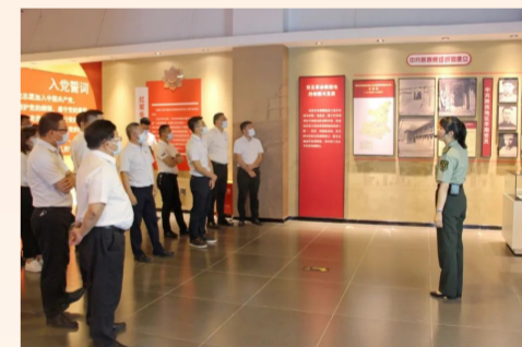
中建方新新疆老城区公司党支部组织党员参观了延安精神新疆教育基地，沉浸式追寻红色记忆，在感受光辉历程中坚定信仰，以红色精神激发奋进力量。