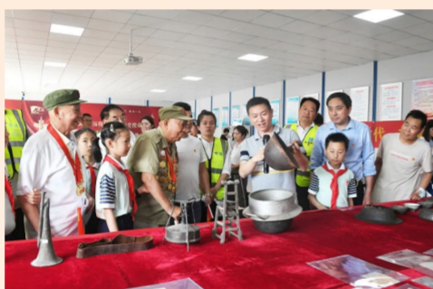
中建五局二公司合肥葛大店幸福城项目党支部联合合肥市新四军历史研究会等单位党组织开展主题党日活动，101位党员群众齐聚一堂，庆祝建党101周年。