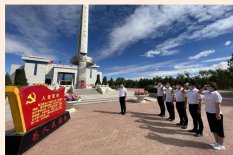
中建六局水利水电公司西北分公司党支部走进宁夏吴忠市盐池县革命历史纪念馆重温入党誓词，向革命烈士敬献花篮，缅怀革命先烈的丰功伟绩。