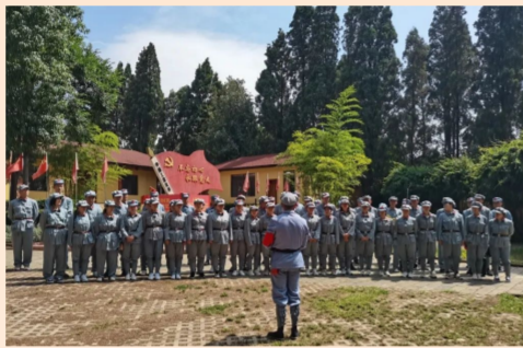
基础部(中建基础)所属云投公司昆明三清高速公路项目党支部赴红军长征柯渡纪念馆进行参观，党员们重走长征路，沿着革命先辈的足迹，重温红色历史。