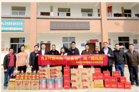
中建市政西北院福建分公司党支部围绕“喜迎二十大 建功新时代”，举办主题党日活动，聚焦长汀县乡村振兴工作，作调研、出规划、助教育，以乡村振兴实效喜迎党的二十大。