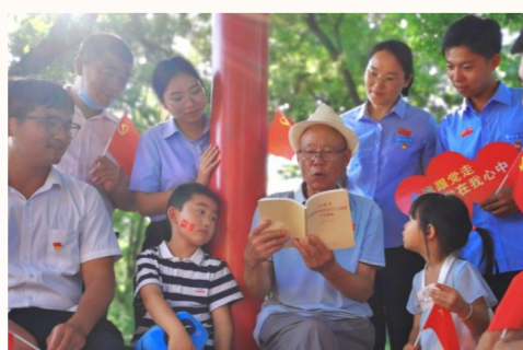
中建丝路(西北区域总部)总承包事业部第一、二、三党支部联合组织事业部干部职工实地观摩牛背梁红色教育基地，重温入党誓词，开展党性教育，接受红色精神洗礼。