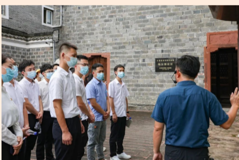
中建四局党员走进法治文化教育基地，了解梅汝璈在东京审判中为中国赢得荣誉和尊严的艰辛历程，激发广大党员干部职工干事创业热情。