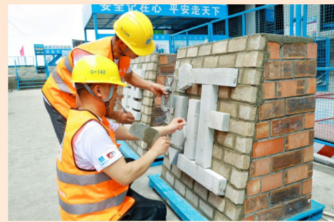
中建二局一公司长沙梦想天悦项目党支部以劳动技能竞赛形式，开展“喜迎二十大 建功新时代”主题党日活动。工人在墙面上砌筑出“喜迎二十大 建证四十年”主题字样。