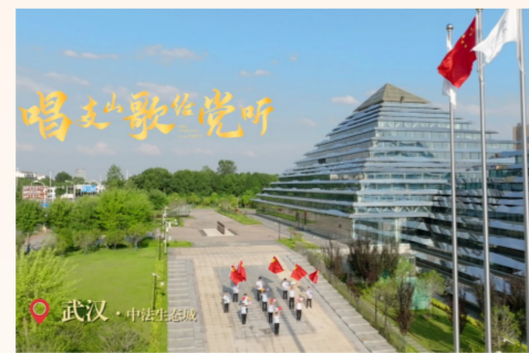
中建科工武汉汉口客运中心项目党支部等7个项目支部以“同唱一首歌”的形式，在国旗下“唱支山歌给党听”，展现新时代中建人的奋斗精神，为建党101周年献上祝福。