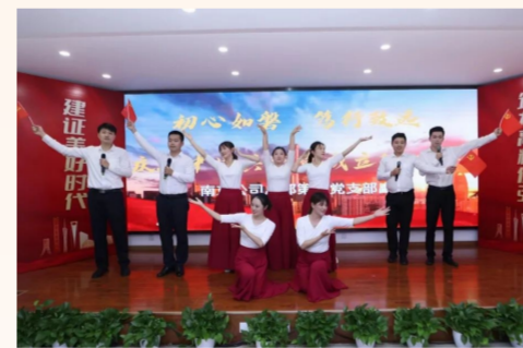
中建安装旗下南京公司组织开展“建证初心 红色传承”主题红歌赛，7个基层党支部精选红色曲目，以悠扬的歌声、动听的旋律，回忆峥嵘岁月，建证美好时代。