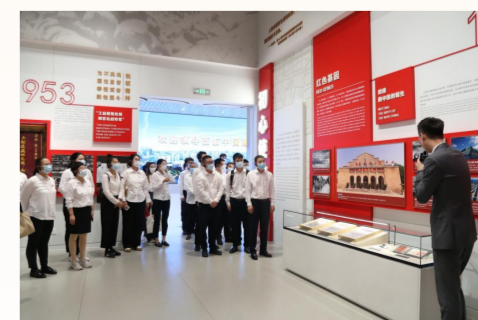
中建产研院党员赴“中国建造之路”企业展厅参观，重温中国建筑40年来奋斗发展历程，感悟中国建筑始终与祖国共奋进、与时代共成长的光辉历程。