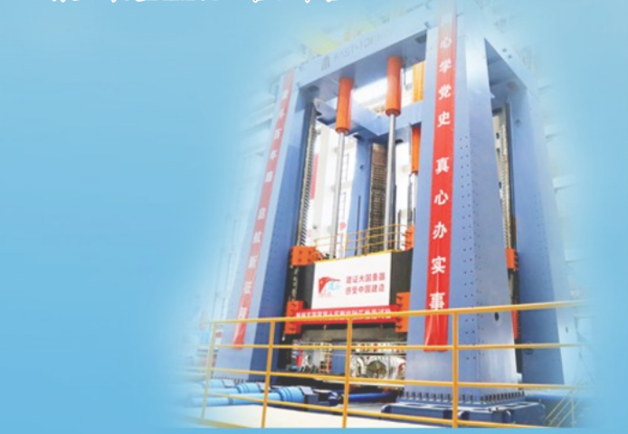
万吨级多功能试验系统