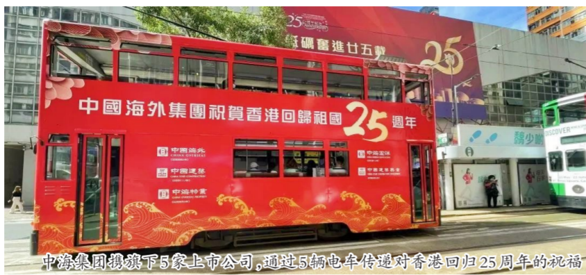
中海集团旗下5家上市公司,通过5辆电车传递对香港回归25周年的祝福

行政长官林郑月娥、香港特别行政区候任行政长官李家超、全国政协副主席梁振英等香港各界人士,多视角讲述香港融入国家发展大局、“一国两制”行稳致远的发展成就。其中,中建集团旗下中海集团董事长颜建国作为驻港中资企业代表,在专访中讲述了中国海外集团在港发展经历、助推香港经济社会发展和“同心抗疫”的事迹,并展望了香港长期繁荣稳定和“一国两制”美好前景。