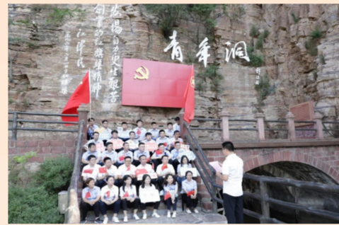
中建一局一公司总部党支部组织党员、青年代表前往安阳市红旗渠红色教育基地接受红色精神洗礼，引导广大党员干部赓续红色血脉，争做时代先锋。