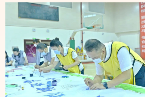
中建西部建设新疆公司机关党支部举办“党史学习大比拼”答题竞赛，党员绘制“喜迎二十大 建证四十年 奋进新征程”巨型长卷，表达对新时代的美好期待。