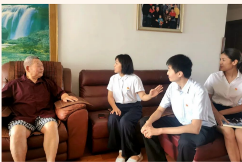
中建装饰所属中外园林陵西分公司党支部拜访原兰州军区空军副参谋长李玉信，聆听老党员讲党课，激励广大党员干部坚定信念，永远跟党走。