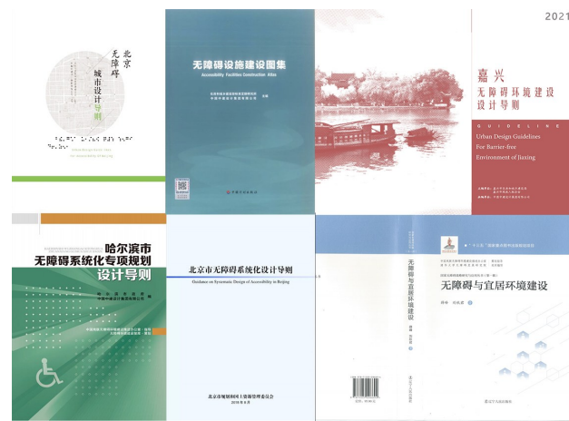
中建设计研究院主编的无障碍标准、导则