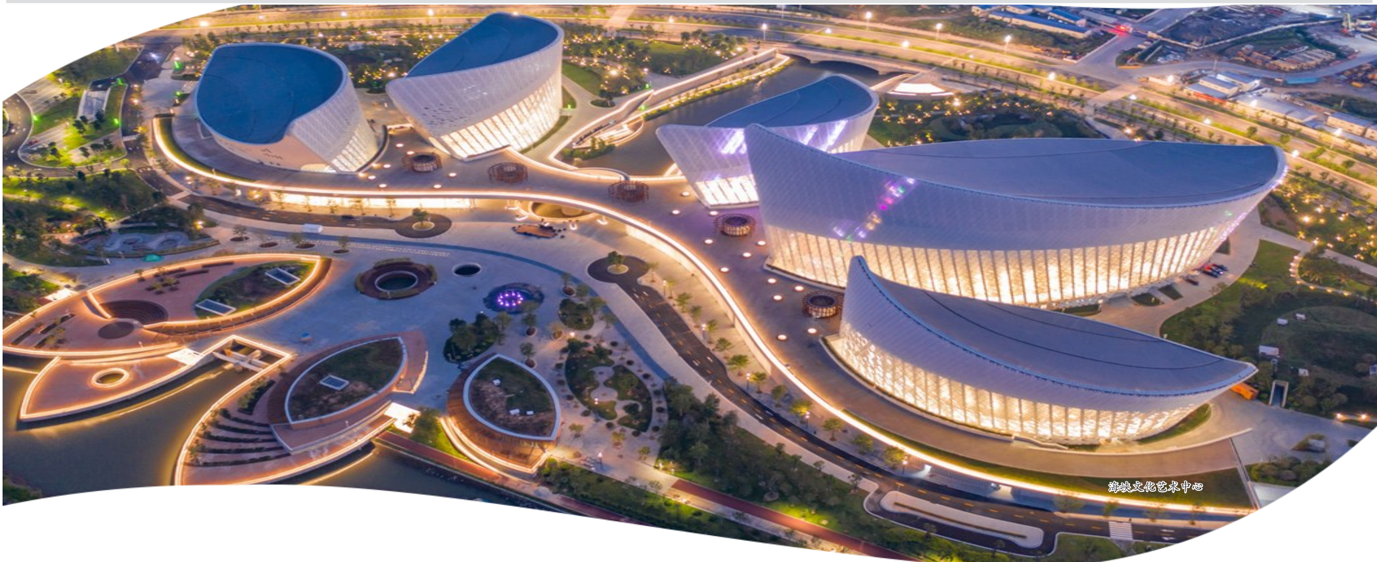
海南文化艺术中心