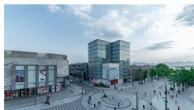
杭州西湖湖滨步行街适老无障碍改造项目

笃行不怠作先锋，“智造”幸福向未来。中建设计研究院将继续踔厉奋发、勇毅前行，持续做强做优做大“中国中建设计研究院”企业品牌，为中建集团实现“一创五强”战略目标贡献积极力量，为庆祝中国建筑组建40周年增光添彩，以优异成绩迎接党的二十大胜利召开！