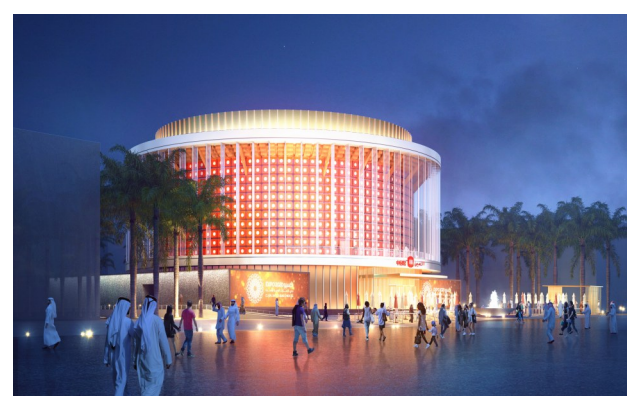
迪拜世博会中国馆