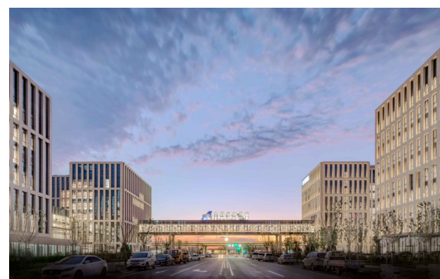
北京大兴国际机场南航运控指挥中心