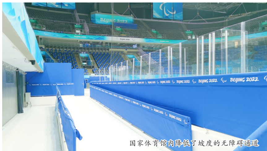
国家体育馆内降低了坡度的无障碍通道

3月13日晚,北京冬残奥会圆满落下帷幕。皎皎冰面,皑皑雪场,来自世界各地的残奥运动员追逐梦想、勇于挑战、超越自我,书写了驰骋冰雪、自强不息的人生乐章。中建集团坚持“以运动员为中心”,细化各项保障措施,匠心打造无障碍建筑,营造舒适便捷、运行顺畅的无障碍环境,为实现“两个奥运、同样精彩”贡献中建力量。