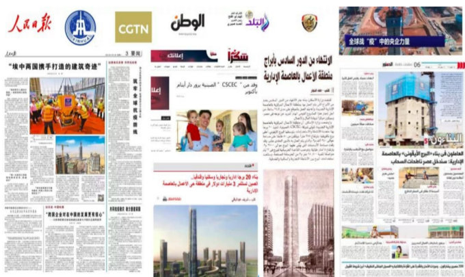
中外主流媒体对中建埃及新首都CBD项目的部分报道