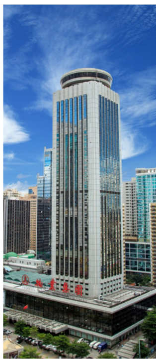
深圳国贸大厦和武汉火神山医院、雷神山医院

课题以中建集团发挥思想政治工作统一思想、凝聚共识、鼓舞斗志、团结奋斗重要作用,有