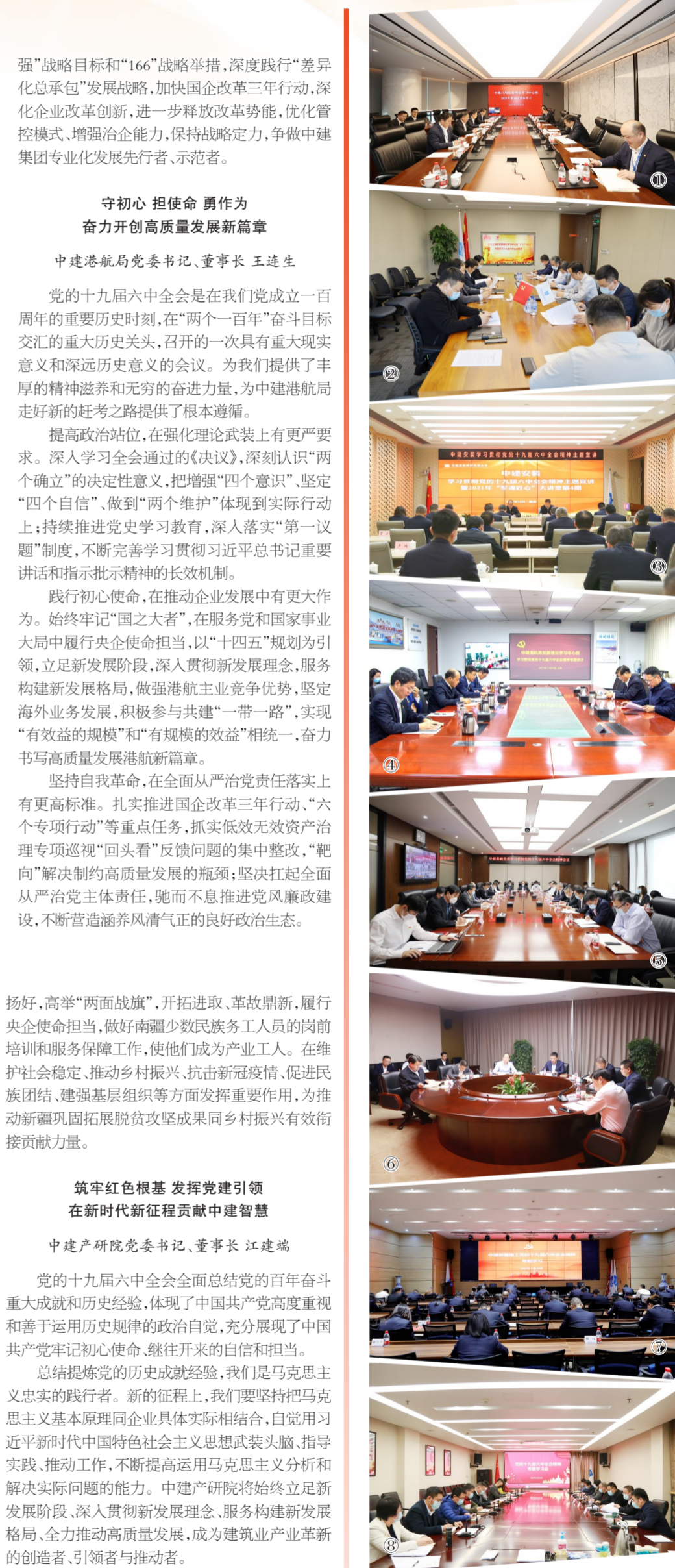
图①:中建八局党委理论学习中心组专题学习贯彻党的十九届六中全会精神。图②:中建上海院党委理论学习中心组开展学习宣传贯彻党的十九届六中全会精神研讨会。图③:中建安装党委举办学习贯彻党的十九届六中全会精神专题宣讲会。图④:中建港航局党委理论学习中心组开展党的十九届六中全会精神专题研讨。图⑤:中建基础党委理论学习中心组专题学习研讨党的十九届六中全会精神。图⑥:中建七局党委理论学习中心组专题学习贯彻党的十九届六中全会精神。图⑦:中建新疆建工总部专题学习党的十九届六中全会精神。图⑧:中建产研院组织各级领导干部学习党的十九届六中全会精神。

踏上第二个百年目标的赶考之路,我们是矢志不渝的奋斗者。当前,我们比历史上任何时期都更接近、更有信心和能力实现中华民族伟大复兴的目标。为实现中华民族伟大复兴的中国梦,中建产研院将始终聚天下英才而用之,努力打造成为中国建筑人才中心和创新高地;将加快攻克重要领域“卡脖子”技术,强化科技自立自强的战略支撑作用;将抓好建筑行业数字化与低碳化的发展机遇,建设成为建筑领域关键原创技术策源地。