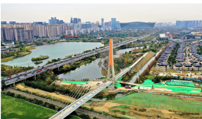
12月17日，中建科工承建的成都环城生态公园项目跨昆铁路桥顺利转体。该桥全长1.3公里，桥面全宽10米，总高为95米，建成后将成为成都市最高人行景观桥塔(慢行系统桥)。（李志聪、李长俊）