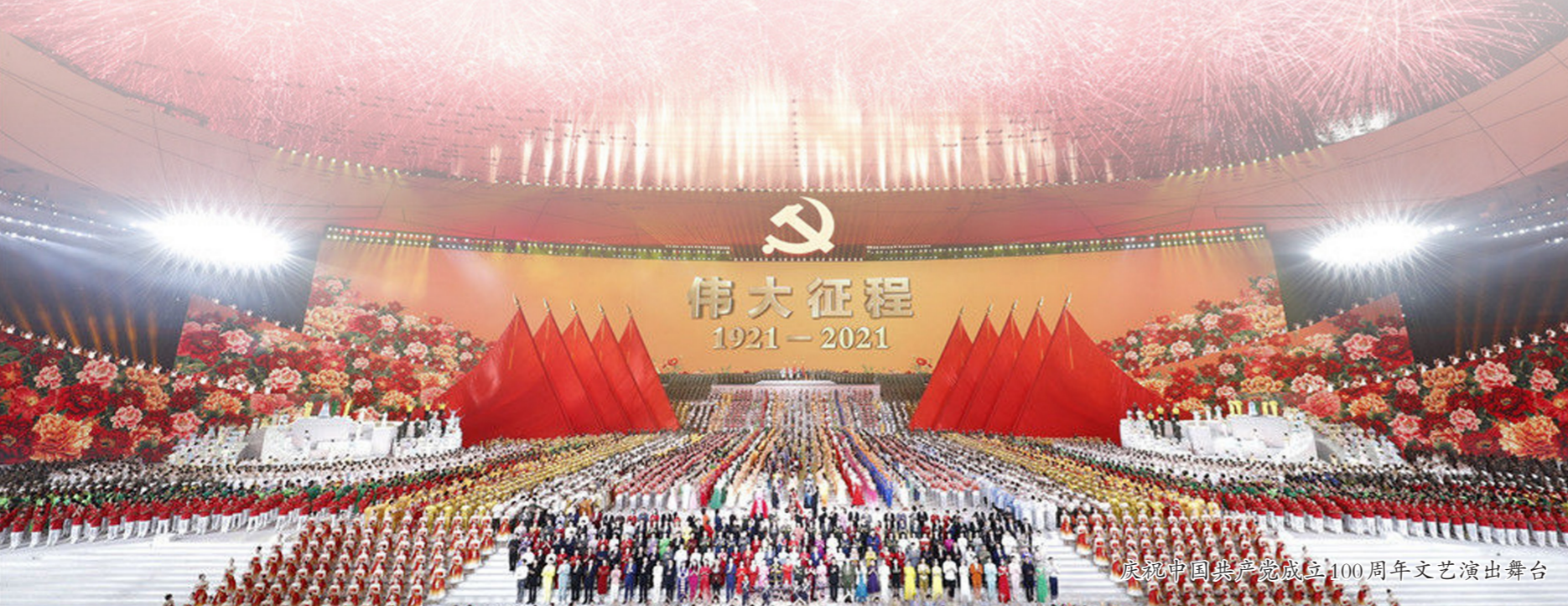
庆祝中国共产党成立100周年文艺演出舞台

会议设1个主会场和467个视频分会场。集团党组成员、股份公司主要领导，总部各部门主要负责人，部分二级子企业及总部派出机构主要领导和受表彰代表在主会场参会；集团总部高级经理及以上人员、二、三级子企业班子成员及部门负责人和受表彰组织、个人共计近1万人在视频分会场参会。