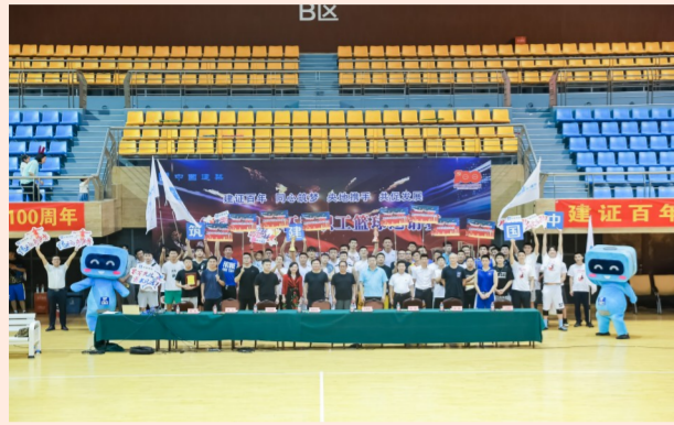
中建基础重庆公司组织中建在渝单位开展“建证百年 同心筑梦 央地携手 共促发展”——“中建巴渝杯”职工篮球联赛，共同庆祝建党100周年。（张健铭）