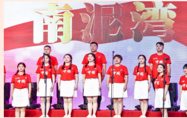
中建二局西南公司举办“最美歌声献给党”职工歌咏会，300余名一线建设者共同庆祝中国共产党成立100周年，讴歌建党百年成就，礼赞建党百年辉煌。（饶昕昕）