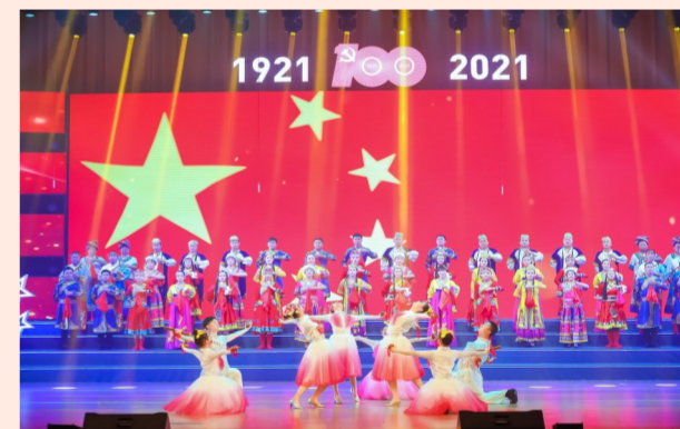
中建西部建设“奋进新时代·开启新征程”主题歌咏晚会上，来自7个省份的1200名员工载歌载舞，庆祝中国共产党成立100周年，热情讴歌伟大新时代。（谢葆兰）