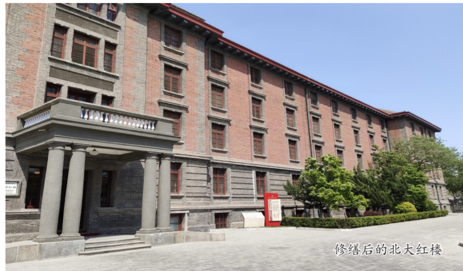
修缮后的北大红楼