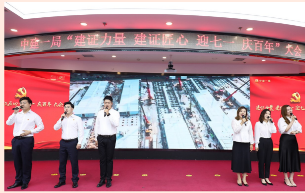
中建一局在京召开“两优一先”表彰大会，党员职工现场演绎党史故事《信仰的味道》、情景剧《百年从此启航》，演唱歌曲《风雨百年》，朗诵诗歌《一路走来》。（品萱）