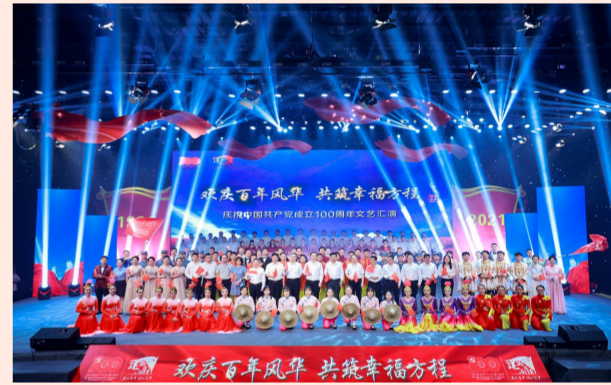
中建方建组织“建证力量 建证匠心 迎七一 庆百年”庆祝建党百年主题活动，对2020年度“两优一先”进行表彰，并在文艺汇演中将主题活动推向高潮。（方建）