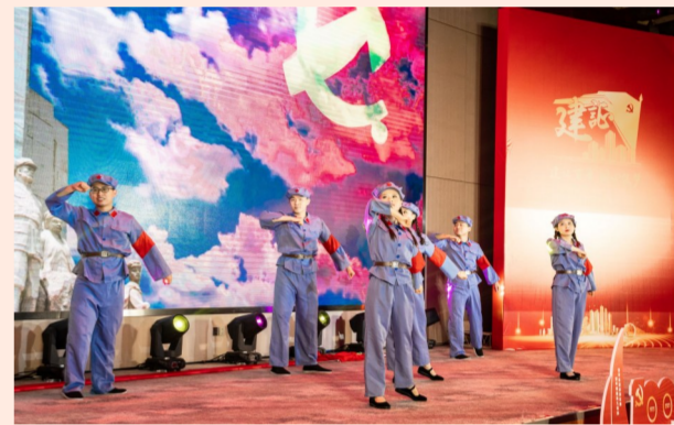
中建七局举办“建证力量·党旗飘扬”庆祝建党100周年“七一”表彰大会，开展沉浸式党课，回顾党的百年历史，弘扬党的优良传统。（邢洛可、肖微）