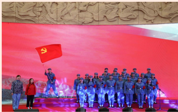
中建四局一公司在贵阳市城乡规划展览馆开展“建证百年 同心筑梦”庆祝建党100周年红歌大赛，唱响红色经典，致敬百年征程。（陈艾君）