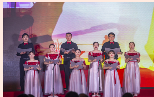
中建安装举办“建证百年 红色向党”七一大型主题活动，高“燃”演绎共产党百年奋斗史和企业40余年的奋进路，线上约1.7万人观看直播。（安宣）