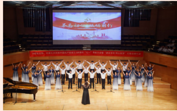
中建东北院、中建北方在沈阳联合举办“建证百年 同心筑梦”红歌合唱比赛，21支队伍、900余名演职人员用歌声点燃爱党热情，用歌声唱响时代强音。（李崇、侯拓）