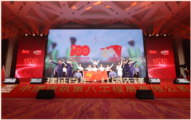
“建证百年·红色先锋”中建八局庆祝建党100周年暨“两优一先”表彰大会回顾中国共产党光辉历程，讲述中建八局奋斗故事，抒发八局人的爱党心、报国情。（王萍）