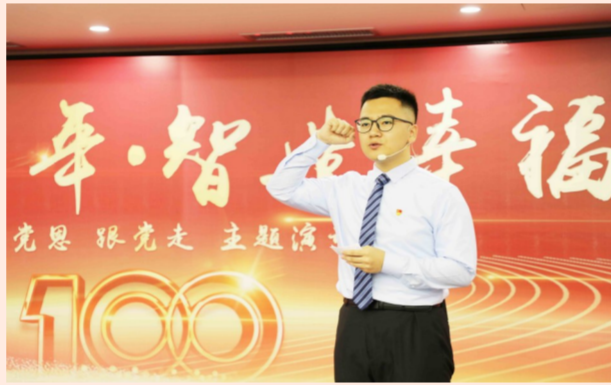
中建设计集团直营总部举办庆祝中国共产党成立100周年主题演讲比赛，33位选手围绕党的非凡历程，演绎企业故事，表达对党的深厚情怀。（于紫硕）