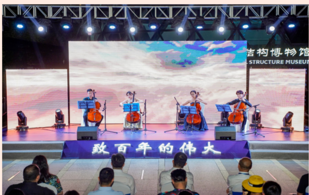
中建科工在深圳中国钢结构博物馆下沉式广场举办“致百年的伟大”专场音乐会，观众们在《映山红》《红星歌》《歌唱祖国》等经典作品中致敬百年伟大历程。（沈希栋）