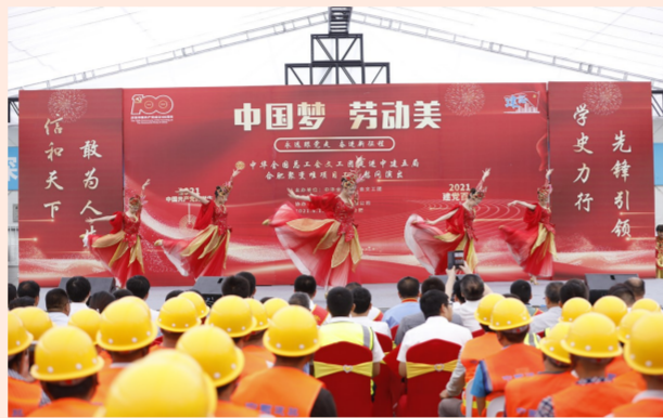
中建五局合肥聚变堆项目300余名建设者在“中国梦·劳动美——永远跟党走 奋进新征程”主题演出中感受伟大时代，礼赞党的百年华诞。（徐辉）