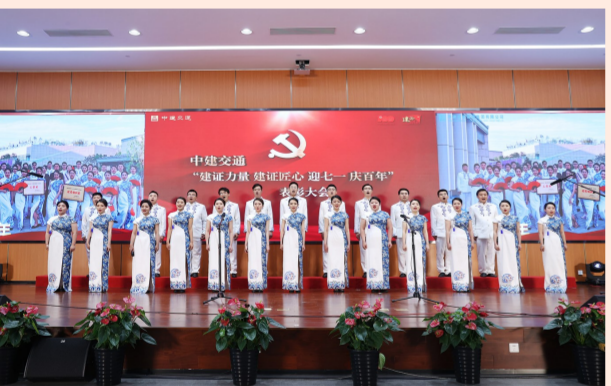
中建交通举办“建证力量 建证匠心 迎七一 庆百年”表彰大会，中建交通总部及子企业的百余名党员职工共唱红歌，“声”情告白，为党和祖国献上祝福。（纪舒玮）