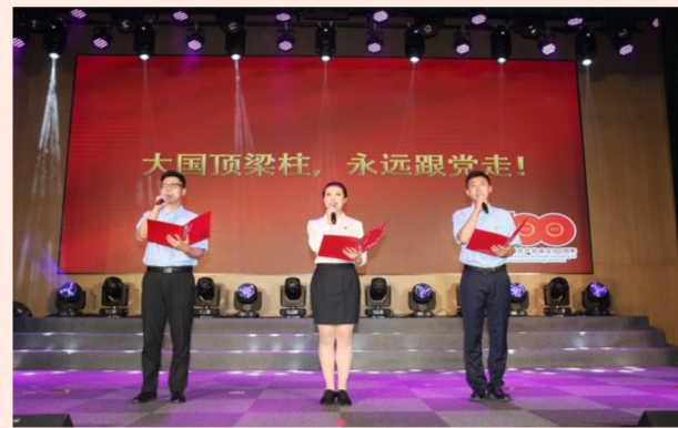
中建六局举办庆祝中国共产党成立100周年表彰大会暨主题展演，节目形式多样，异彩纷呈，情景朗诵《红色家书》、红歌联唱将活动气氛推向高潮。（陆轩）