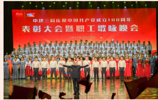
中建三局1700余建设者在庆祝中国共产党成立100周年表彰大会暨职工歌咏会上，唱响红色主旋律，回顾峥嵘岁月，礼赞伟大时代，讴歌美好明天。（钟三轩）