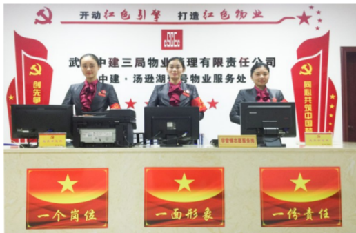
中建三局物业公司建立机关党员服务基层“红色联系点”制度，将“红色物业”工作纳入“三个标准”体系，营造邻里文化、楼栋文化、小区文化，传递党的声音，夯实红色阵地。（徐彬）

中建一局首次尝试“云开放”，创新基层党建新形式，通过云党课、云观摩、云宣讲、云建证等系列活动，覆盖了11个全局最优秀的项目，涵盖民生工程、基础设施超级厂房、房地产等领域，累计120余万人观看，多家媒体进行了报道，赢得良好的品牌美誉，充分展示了一局标杆工程党建风貌、工程形象、文化品牌，进一步加强了党建联建，促进了合作共赢，为助推生产履约和开拓市场奠定了良好的基础。（品萱）