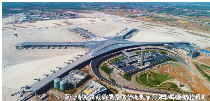
图为中建西南院设计的青岛胶东国际机场航站楼项目

从世界上首个大跨度椭圆形索承单层网壳结构的常州体育会展中心体育馆，到当时国内最大跨度的铝合金单层网壳结构的成都中国现代五项赛事中心游泳击剑馆，再到首创大开口车辐式索承网壳结构的江苏徐州奥体中心体育场……经过多年探索和持续投入，中建西南院聚焦绿色建造、智慧建造、