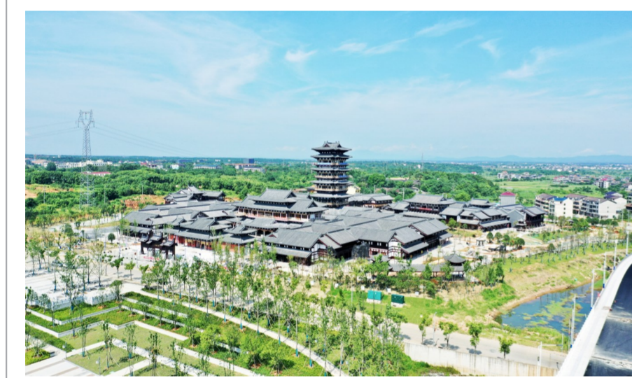
近日,由中建五局投资建造的江西省最大仿宋建筑群项目临汝书院完工,项目集研学、文旅、情景商业于一体,将成为江西一站式文旅目的地。(刘羽、苏乾)

近日,中建市政负责履约的山东枣庄水辰·君悦府工程项目顺利通过主体结构验收。(王普庆)