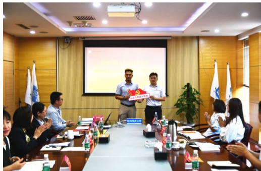
中建六局陆海投资公司结合工程局及公司党委要求设置了“心动力”党员示范岗，发挥党员在公司各业务线的模范带头作用，将总部党支部打造成助力企业高质量发展的“红色基石”。（陈鹏）