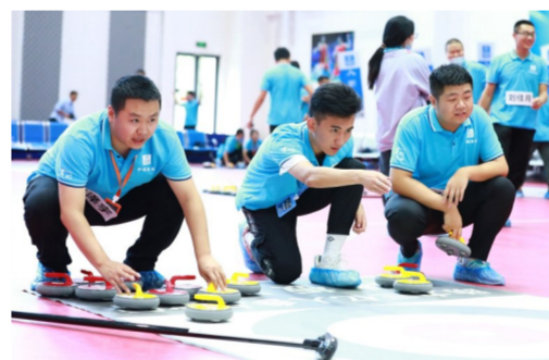
2022北京冬奥会倒计时500天之际，中建安华北公司举办首届冰壶挑战赛，引导员工享受健康生活。(谭健)