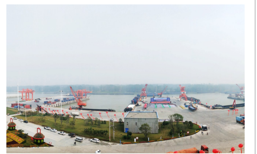
周口中心港至上海港、盐城大丰港集装箱水运航线将于明日正式开航。周口中心港是河南省最大的内河港口,码头工程由中建港航局承建。(王鑫鑫)