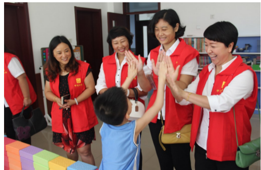
为推动集团“建证”党建品牌活动在物业服务一线深入开展，中建二局地产公司开展“红心”“爱心”“贴心”活动，有效打通了党组织联系服务群众“最后一公里”。（郭鑫）

中建三局承建的武汉环东湖绿道是国内首条中心城区5A级景区绿道，构建了集人文、生态、智慧于一体的绿道网络体系。东湖绿道契合东湖“城湖共生、水绿交融”的整体空间格局，构建区域联动、体系完善、布局合理、特色多样、设施完备、环保智能、衔接方便的绿道网络系统，被联合国人居署评为“改善城市公共空间示范项目”。建设过程中，由中建三局牵头研发了城市环湖绿道人文景观慢行网络系统的规划和设计技术、基于生态保护的环湖绿道建造系列技术、绿道智能化集成管理服务系统，整体成果达到国际先进水平。