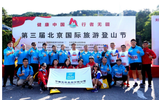
9月22日，第三届北京国际旅游登山节在慕田峪长城开幕，在48支企业代表队参加的团队赛中，中建集团代表队获得第五名。(功宣)

“我们全家4口人，领到了3000多元！”“我们老两口，领到了900元！”领到红包的村民们喜不自胜，他们做梦也没想到，农民也能当股东，分红领现金。