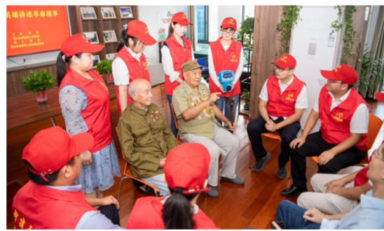
近日，中建五局安徽公司超英志愿者慰问致敬抗战老英雄，向老英雄献上鲜花，并认真聆听老英雄们分享抗战经历。(张超群、程敏)