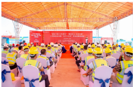
9月19日，中建四局汕头澄海PPP项目“建证力量·红色基石”“建证匠心·红色先锋”三号联动活动暨“大千100天”劳动竞赛启动大会在一分部东里河北岸举行。（刘艳玲）

通过“123”工作法的实施，大运会项目联合党支部将党建工作成效转化为履约创效动力和创先争优实力，支部获省部级以上科技奖12项，完成专利84项，工期履约安全可控，获得了各方的一致肯定。（杜嵩、黄娟娟）