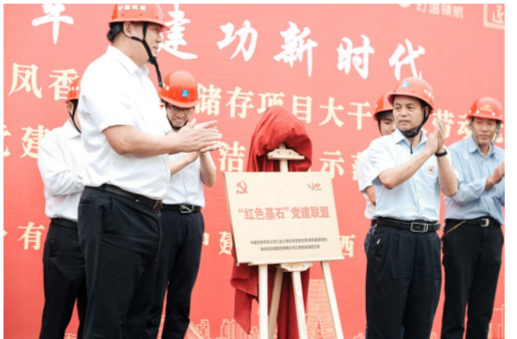
中建安装华西公司工业工程大项目部党支部积极与业主单位开展联学共建活动，并成立“红色基石”党建联盟，深入推进“组织、工作、学习、文化”四个有机融合。（高瑾）