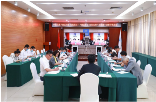
9月24日，中建交通召开“建证力量·红色基石”“建证匠心·红色先锋”活动督导推进会，对活动内容进行逐项分解落实，明确完成目标及完成时限，加快推进集团“建证”党建品牌活动落地。（焦桐）